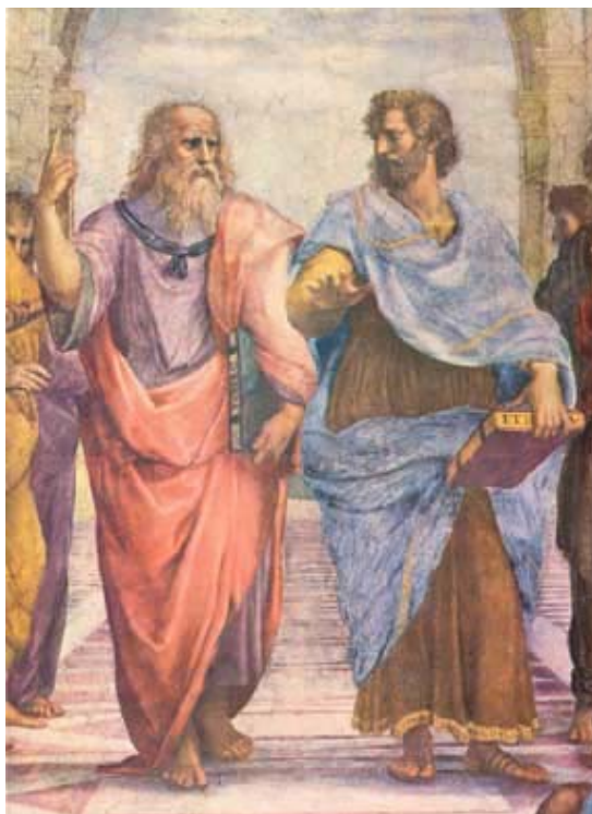
Raffaello Sanzio: L'École d'Athènes (fresque de la Stanza della Segnatura, Palais du Vatican – détail). À gauche Platon indique le ciel, en tenant dans les mains le livre du Thymée, tandis que à droite Aristote tient le livre de l'Étique et indique la terre.

Ce moment historique est celui où, d'après moi, se situe la distinction entre la pensée philosophique de Platon et les idées d'Aristote, le moment où l'on sépare les chose du ciel de celles de la terre, qui avant étaient une seule chose.