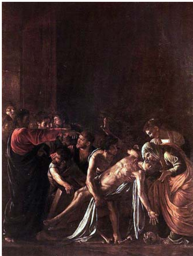
Le miracle plus convoité, la magie plus sophistiquée: La résurrection de Lazare, peinte par Caravaggio

La magie produite ne sert à rien si elle a été obtenue sans conscience et à quoi bon de la produire si on a pas conscience de soi?